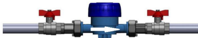
Joonis 1. Paigaldusnäide